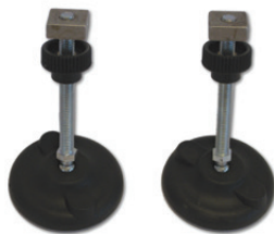
Art. 07505160 | kit piedi snodati 2 pz 2 supports with mobile rests